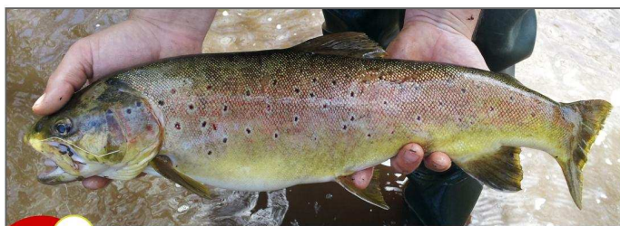
Magnifique truite de 54 cm capturée en 2013 à la cuiller sur la Corrèze à Corrèze

La fusion des deux AAPPMA a été bénéfique et les membres continuent de nous faire confiance puisque 2013 a vu une augmentation de 8.5 % du nombre total de cartes vendues et de près de 10% de nos membres statutaires. MERCI A VOUS !