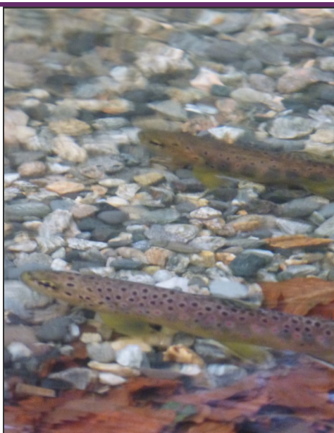
Truites sur une frayère créée par l'AAPPMA des Monédières à Pradines en 2017

L'AAPPMA a réalisé des frayères sur le ruisseau du Mazaleyrat à Pradines. Merci à l'entreprise Flamary d'Argentat pour la fourniture des graviers et aux bénévoles présents pour leur investissement.