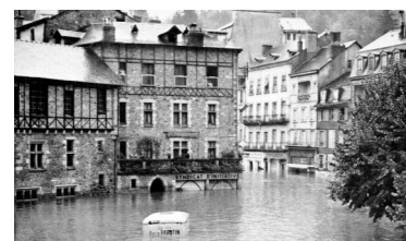
Le quartier du Trech inondé à Tulle en 1960

« C'est une triste chose de songer que la nature parle et que le genre humain n'écoute pas. »